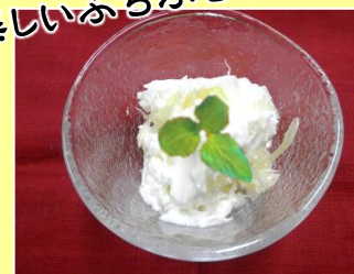
晩白柚ヨーグルトゼリー