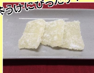
晩白柚の砂糖漬け